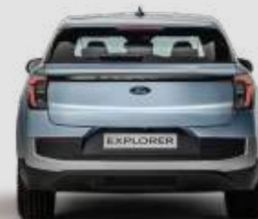
Szerokość całkowita z lusterkami bocznymi: 2063 mm