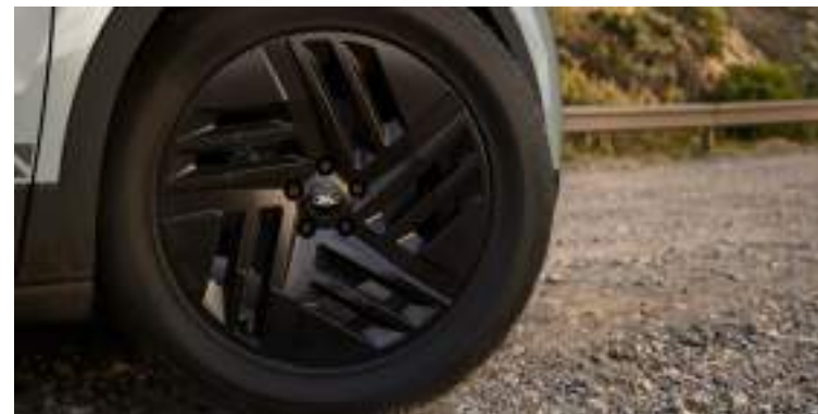
20"obrycze kół ze stopów lekkich Wyposażenie standardowe wersji Collection