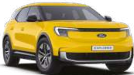
VIVID YELLOW - lakier zwykły bez dopłaty Lakier niedostępny dla wersji Collection