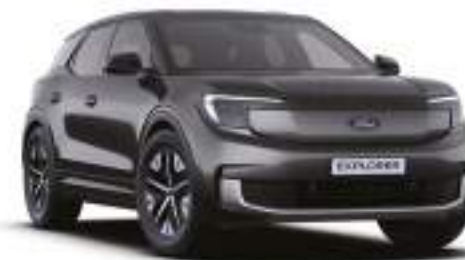
MAGNETIC GREY - lakier metalizowany 3 000 zł Lakier niedostępny dla wersji Collection