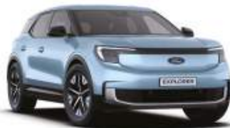
ARCTIC BLUE - lakier metalizowany 3 000 zł Lakier niedostępny dla wersji Collection