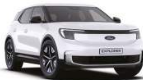
FROZEN WHITE - lakier zwykły 1 500 zł Lakier niedostępny dla wersji Collection