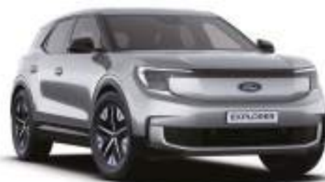
SOLAR SILVER - lakier metalizowany 3 000 zł Lakier dostępny tylko dla wersji Collection