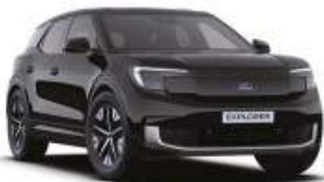
AGATE BLACK - lakier metalizowany 3 000 zł Lakier niedostępny dla wersji Collection