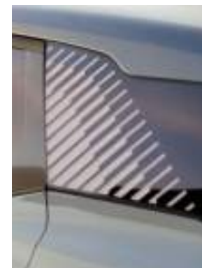
Charakterystyczne akcenty na słupku C oraz po bokach pojazdu Wyposażenie standardowe wersji Collection