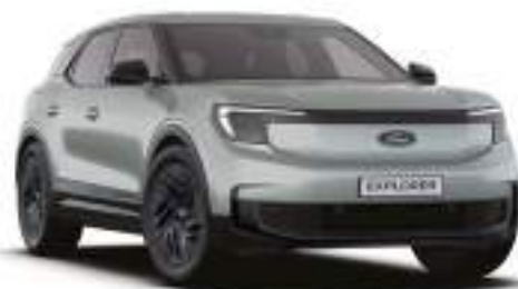
CACTUS GREY - lakier specjalny Bez dopłaty Lakier dostępny tylko dla wersji Collection