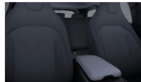
Ford Explorer® w wersji Explorer w kolorze Solar Silver (wymaga dopłaty) Wnętrze: Tapicerka materiałowa (wyposażenie standardowe)