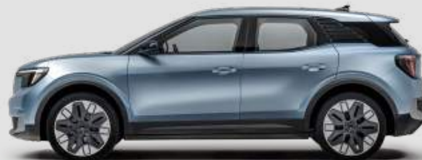
Długość całkowita 4468 mm

Pomiar zgodnie z normą ISO 3832. Rzeczywiste wymiary mogą się różnić od podanych wartości w zależności od wersji i wyposażenia. Wszystkie podane wyżej wartości są danymi fabrycznymi.